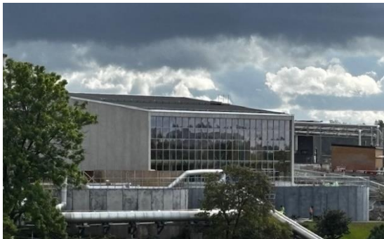
Bild 1. Slamkylbyggnaden 2025-09-17

I Sickla pågår betongarbeten för försedimenteringsbassänger och pumpstationen. Byggnadsarbeten och installationer pågår även i den nya teknikbyggnaden utanför bergutrymmet. Kritisk tidslinje för Sicklas arbeten är påverkat av den försenade bergentreprenaden som styr när Bromma kan kopplas in. Åtgärder av befintliga delar som visat sig vara i dåligt skick pågår också.